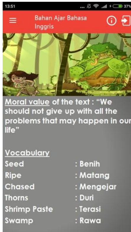
Gambar 1. Desain Aplikasi Pembelajaran Teks B. Inggris Berbasis Sistem Operasi Android