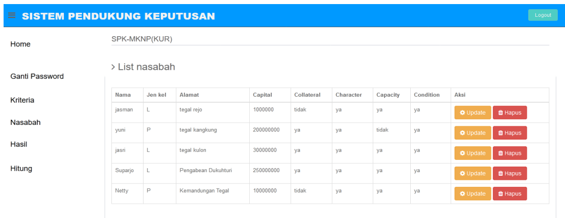
Gambar 3. Halaman data Nasabah

Kemudian pada menu Nasabah dapat diinput data nasabah dengan beberapa variabelnya yang ditunjukkan pada gambar 3.